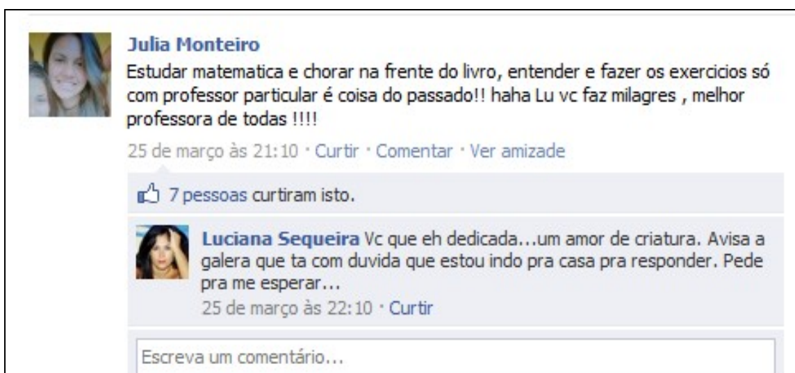
Figura 3 – Conversa entre professora e aluna no Facebook

Para compreendermos como se estabelecem esses laços e como emerge o capital social, vamos nos deter nas telas a seguir: