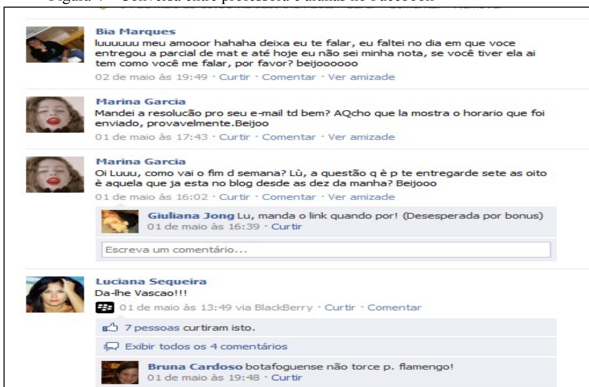
Figura 4 – Conversa entre professora e alunas no Facebook

Na tela a seguir (Figura 4), podemos observar a interatividade entre alunos e a professora, a partir da perspectiva de uma comunicação menos hierarquizada, tecida de forma mais rizomática, em que não há uma separação dicotômica entre escola e cotidiano: