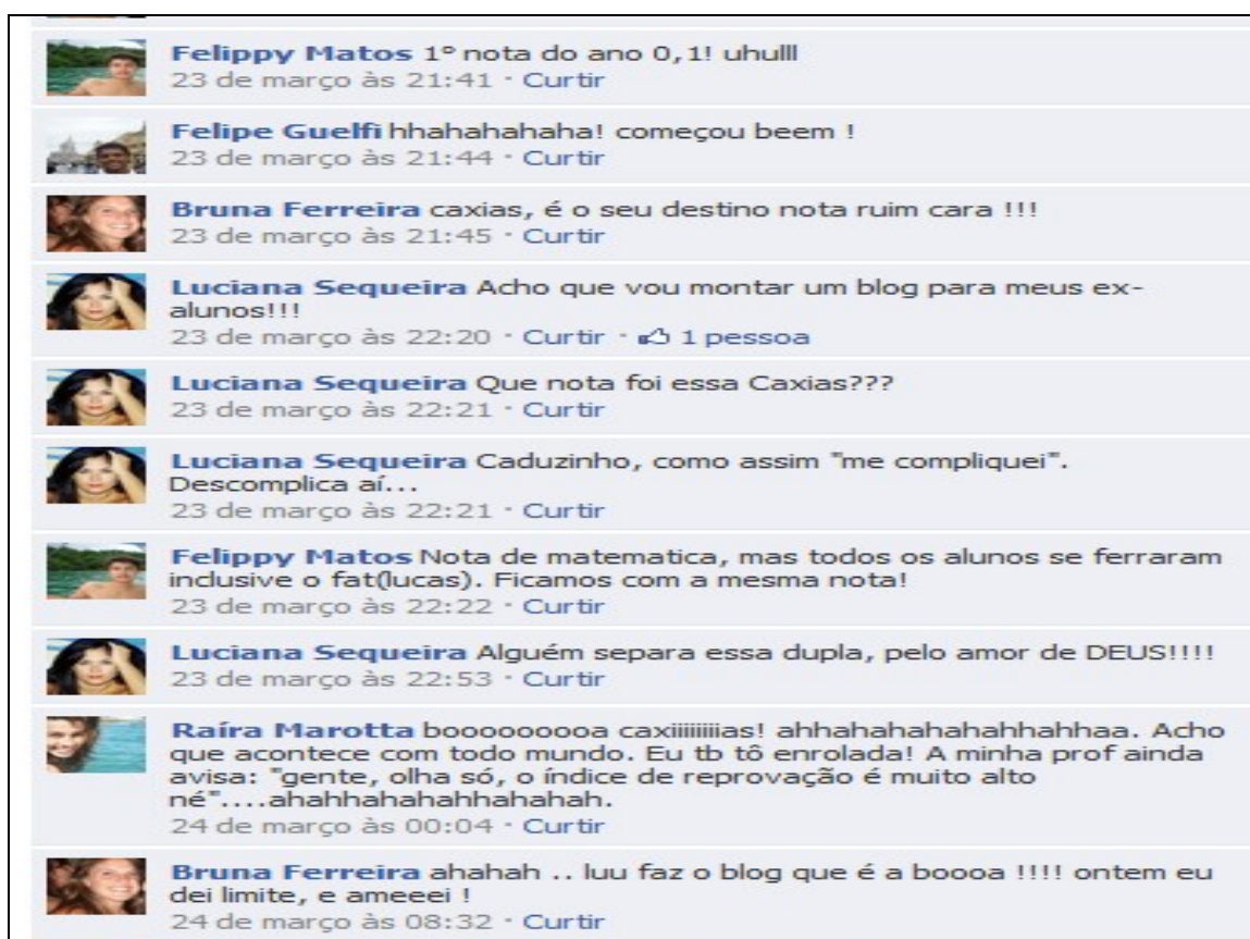
Figura 5 – Conversa entre professora e alunos no Facebook

Assim, o Facebook pode ser entendido como um sistema rizomático, sem centros de significância 17 , sem centros de comando, sem unidade superior, e, talvez por essa razão, seja utilizado pelos alunos como espaçotempo de comunicação entre a escola e o cotidiano.